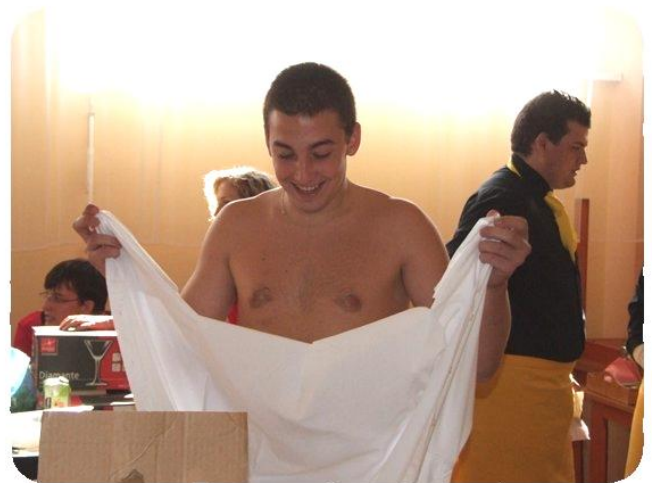
I na dobrém oblečení záleží a tak i jeho kontrola je nezbytná. Obrázek z přípravy soutěžících.

Spoustu obrázků z průběhu soutěže najdete ve fotogalerii na webu www.hotelovkajes.cz