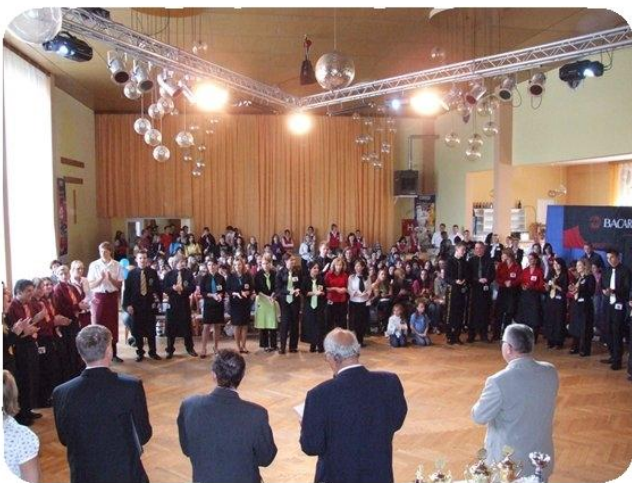
Pohled na slavnostní nástup soutěžících, po kterém následoval rozhod a nástup k přípravě na soutěž.