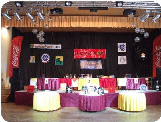
V sále hotelu Zlatý Chlum v České Vsi je vše připraveno k zahájení Lázeňského Baccardi poháru 2009