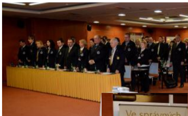
Foto VÝROČNÍ ČLENSKÉ SCHŮZE CBA: